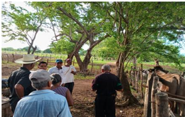
Figura 2. Evaluación del semental